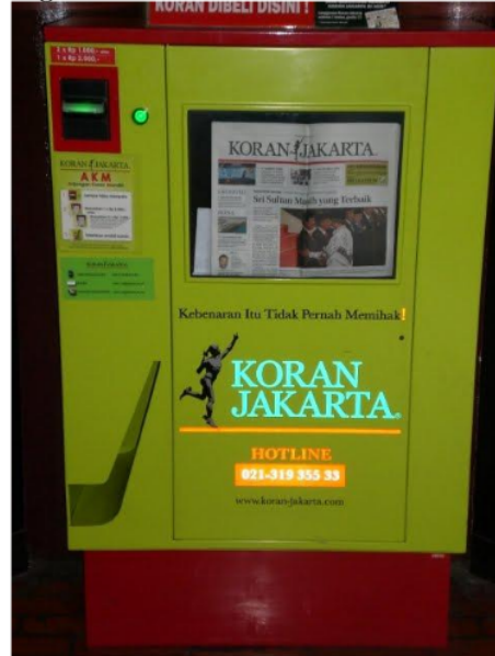
Gambar 1. Vending Machine di Indoensia

Vending Machine pertama kali hadir di Jepang pada tahun 1930 yang masih menggunakan kayu sebagai bahan dasarnya. Saat ini Vending Machine banyak dimanfaatkan negara-negara berkembang untuk memudahkan transaksi jual beli barang.