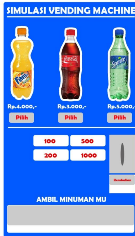
Gambar 3. User Interface Vending Machine

Penelitian ini menghasilkan sebuah rancangan User interface simulasi Vending Machine . Simulasi User Interface ini dibuat sesuai dengan Vending Machine yang banyak digunakan atau umum digunakan dikalangan masyarakat. Desain interface Vending Machine menggunakan Bahasa pemrograman Delphi. Berikut ilustrasi desain simulasinya :